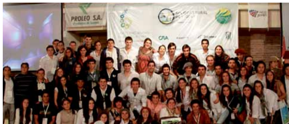
CRA apuesta a la juventud para formar a los futuros líderes rurales

En la sociedad rural de Leones, un gran número de ateneístas de CRA se concentraron para la realización del 6º Encuentro de Jóvenes de Cartez bajo el lema “Capacitando la juventud, conquistando el futuro”.