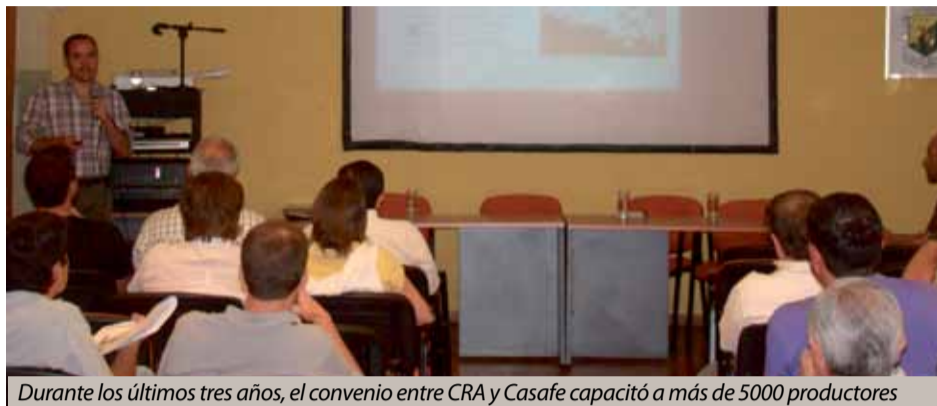
Durante los últimos tres años, el convenio entre CRA y Casafe capacitó a más de 5000 productores

“Queremos producir con responsabilidad, con agroquímicos que no causen daños ni