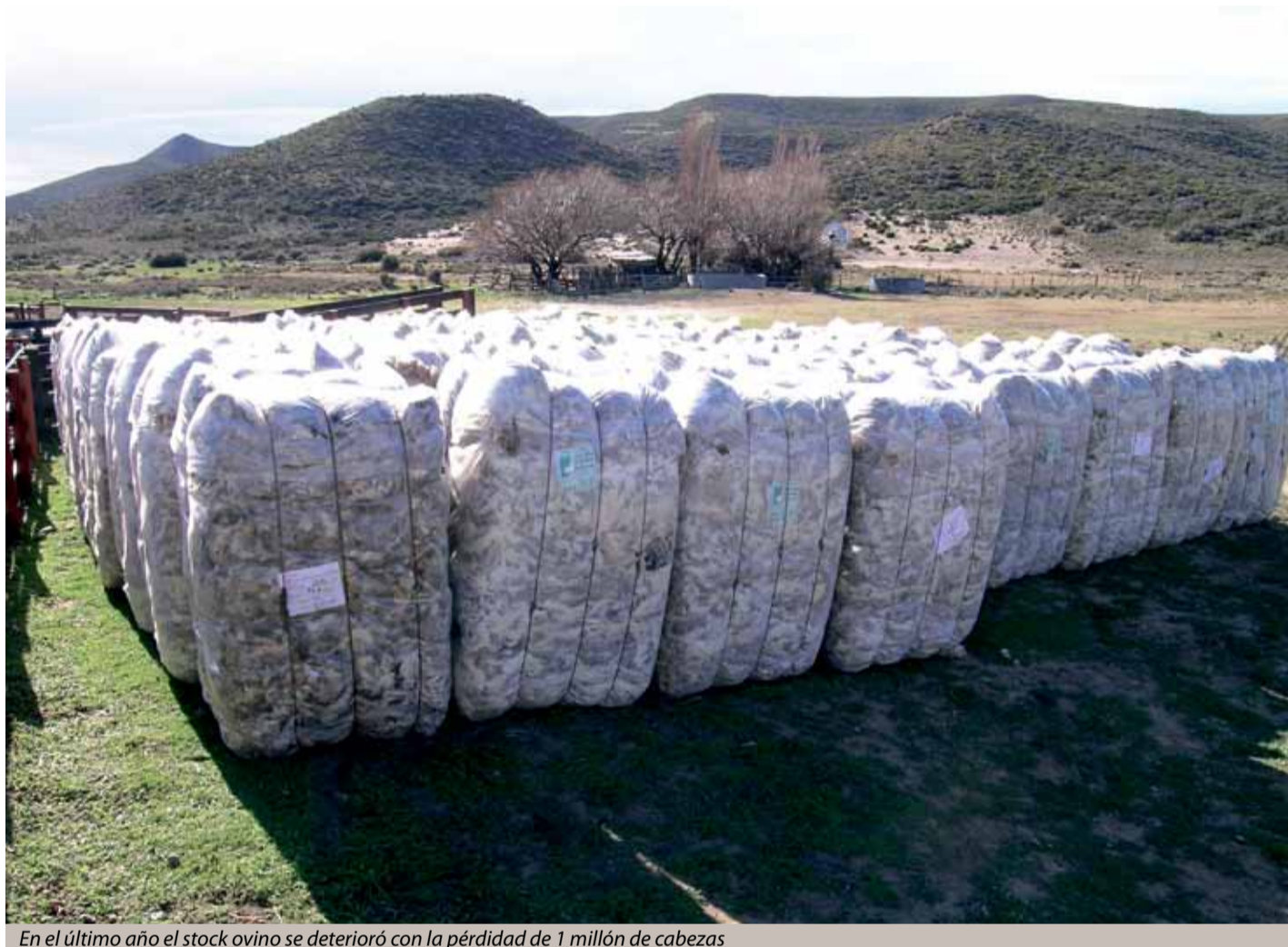
En el último año el stock ovino se deterioró con la pérdida de 1 millón de cabezas

En la Sociedad Rural de Esquel productores denuncian falta de acompañamiento provincial ante la complicada situación productiva.