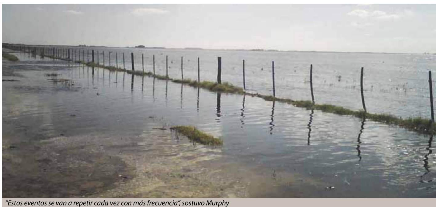
“Estos eventos se van a repetir cada vez con más frecuencia”, sostuvo Murphy

décadas del 40 y 50, cuando fueron diseñadas gran parte de las obras de Buenos Aires, la ciudad tenía una relación de escurrimiento e infiltración cercana al 50%. Hoy, esa relación cayó a 10%, porque desaparecieron muchos espacios verdes y el terreno fue cubriéndose con concreto, que no absorbe el agua. “Por eso pensamos que la adaptación al cambio climático comienza por la implementación de políticas al respecto y un plan de contingencia, que hoy, en la práctica, no existe”, dijeron los docentes de la Fauba.