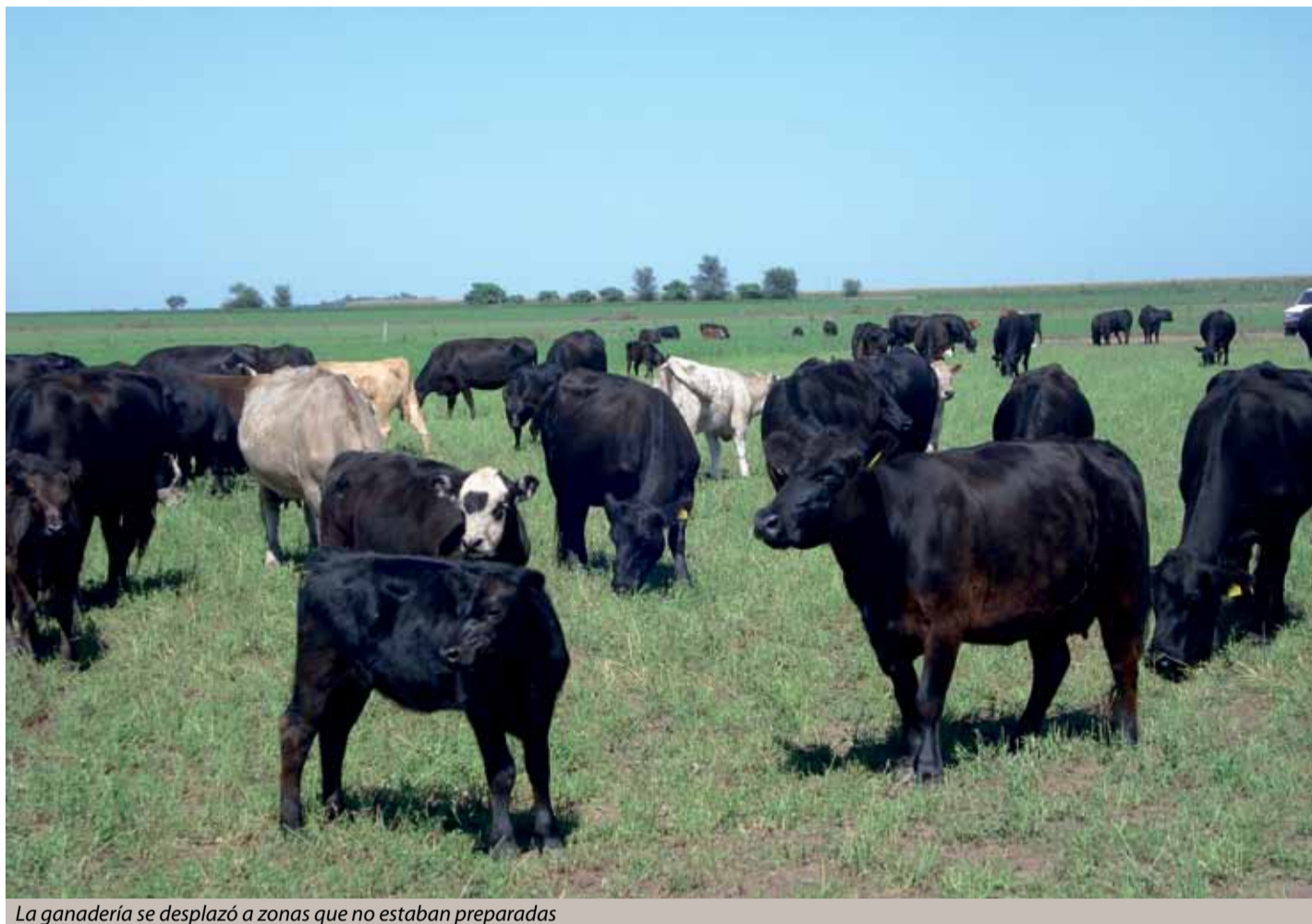
La ganadería se desplazó a zonas que no estaban preparadas

Esas pasturas también poseen raíces más desarrolladas que las especies anuales, por lo que utilizan mejor el agua de lluvia e incorporan más materia orgánica y mejoran la calidad del suelo. Así, estos procesos extienden el período de aprovechamiento de la pastura, dan mayor tolerancia a la sequía