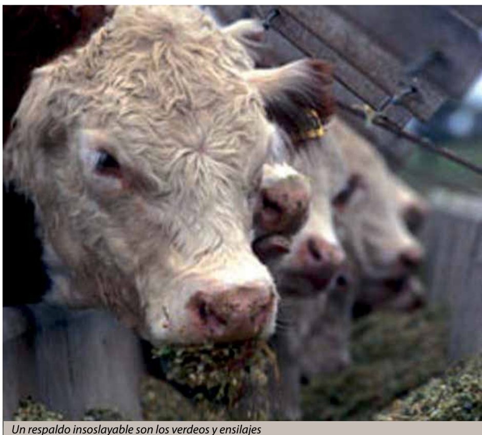
Un respaldo insoslayable son los verdeos y ensilajes

Los especialistas determinaron que el pastoreo restringido en horas es una he-