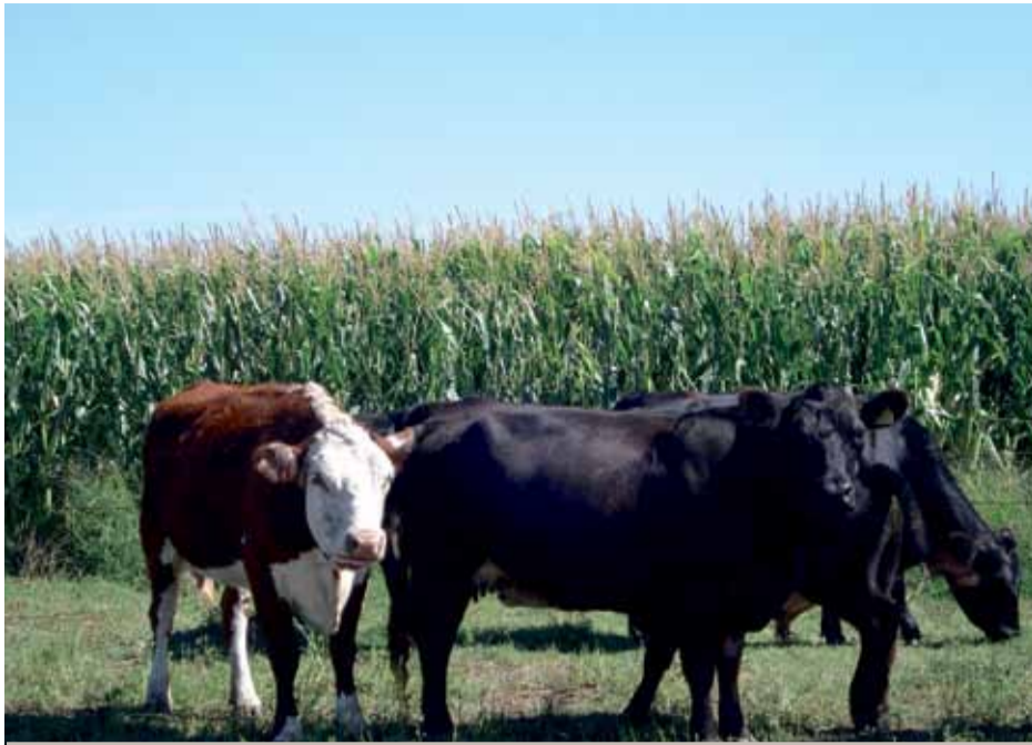
El pastoreo restringido en horas es una herramienta muy eficiente

Para un manejo adecuado recomiendan tener en buenas condiciones los alambrados eléctricos de los callejones o plazoletas donde permanecen los animales.