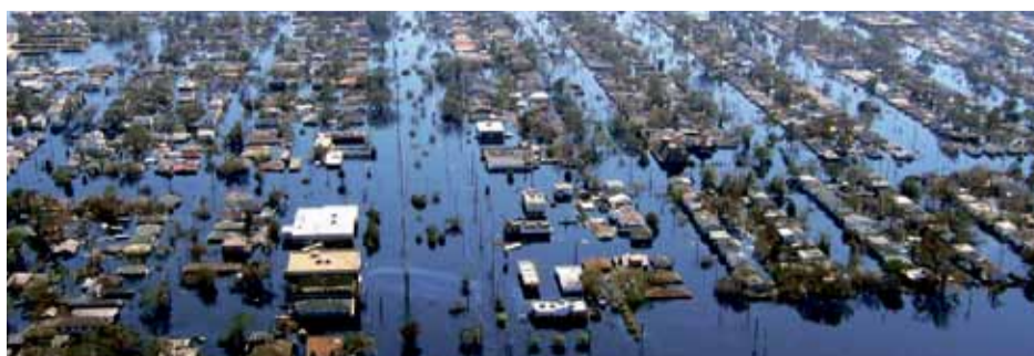
En La Plata, el SMN registró una caída de 181 mm

“La situación también es complicada porque otoño es una estación lluviosa y con temperaturas bajas, que no ayudan a que el agua se evapore. Lo que llueva va a ser incorporado al suelo y, si hay agua en superficie, va a quedar”, lamentó. ▼