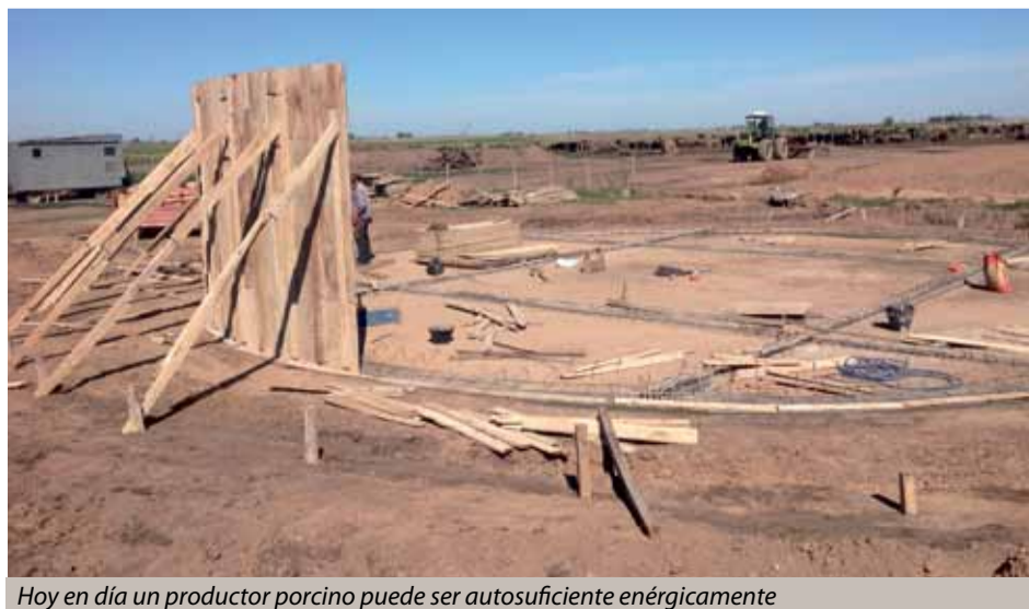
Hoy en día un productor porcino puede ser autosuficiente energéticamente

A su vez, Pinos concluye: “Al productor siempre le interesa aumentar su rentabilidad, por eso nosotros no pretendemos venderle un proyecto muy costoso que después no pueda manejar, sino simplemente analizar el perfil de cada uno y adaptarse a las necesidades y a cada explotación en particular”. ▼