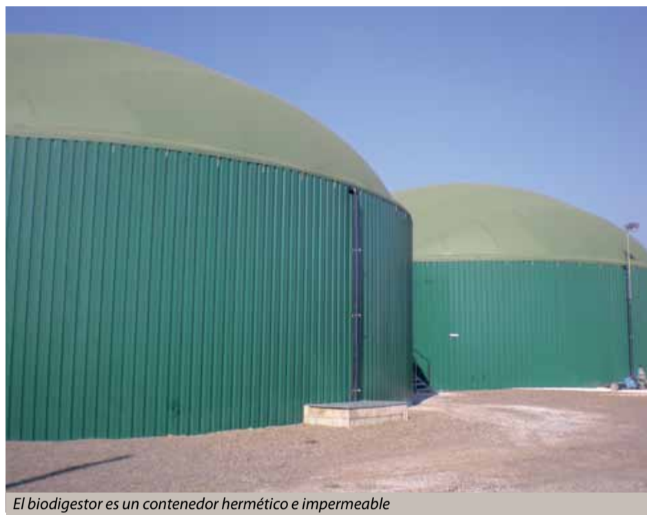
El biodigester es un contenedor hermético e impermeable

En Alemania, por ejemplo, hay cerca de 9.000 plantas que pueden procesar sustratos muy variados.