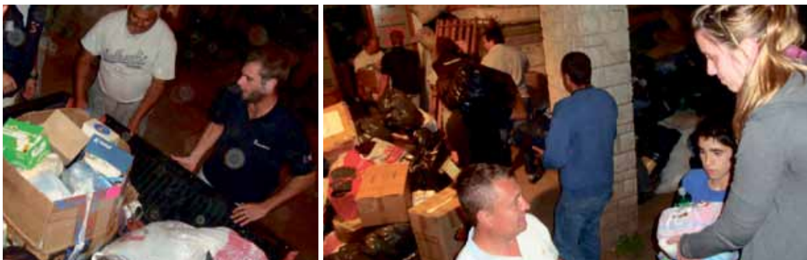
El Ateneo de La Plata centralizó las donaciones de otras confederaciones

Una vez más, los productores a través de distintas instancias, ofrecieron su tiempo y esfuerzo para colaborar ante distintas necesidades sociales. Sus manos se volvieron a juntar ofreciendo una “gauchada” frente a esta triste adversidad. ▼