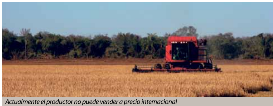
Actualmente el productor no puede vender a precio internacional

Con una siembra estimada en 4M de hectáreas, la caída de los cereales agudiza la pérdida de la fertilidad del suelo. Un año con políticas adecuadas bastaría para revertir la situación.