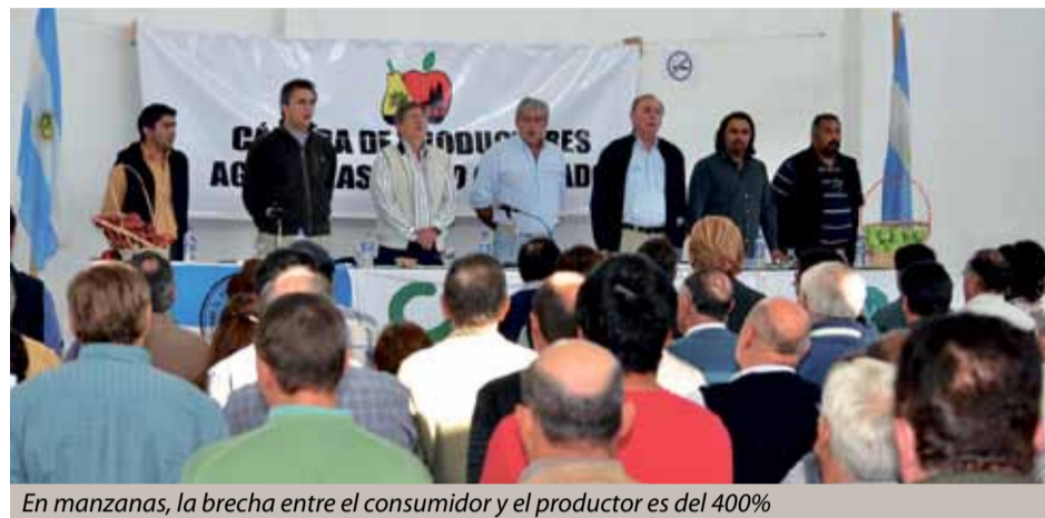
En manzanas, la brecha entre el consumidor y el productor es del 400%