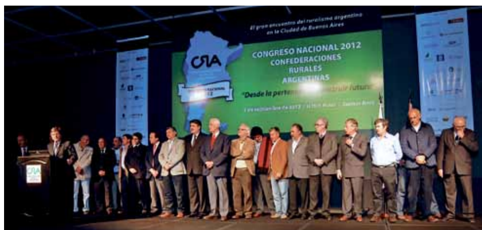
El año pasado el encuentro fue en Capital Federal