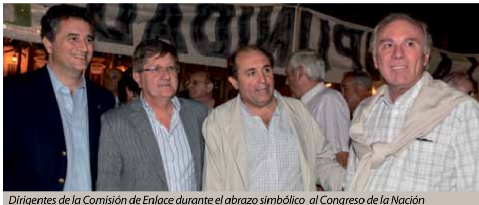
Dirigentes de la Comisión de Enlace durante el abrazo simbólico al Congreso de la Nación

Otros dirigentes como el ex presidente de CRA, Mario Llambías, aclaró que el abrazo al Congreso "es una manifes-