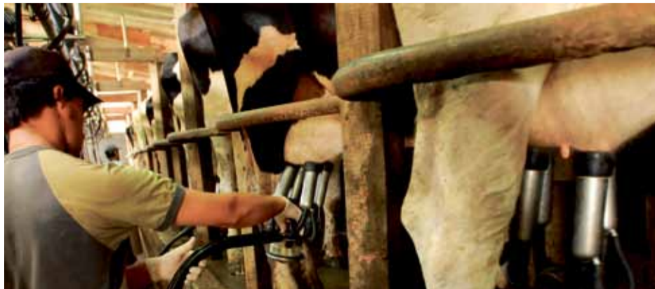
El precio del litro de leche cruda debería llegar a los $2,20

Sobre este último punto gira una vieja y presente lucha de los tamberos: la recomposición del precio deprimido que reciben por el litro de leche cruda, precio que a esta altura del partido y de la inflación de un 25% se plantó en un deprimido promedio de $1,75, cuando debería al menos llegar a los $2,20.