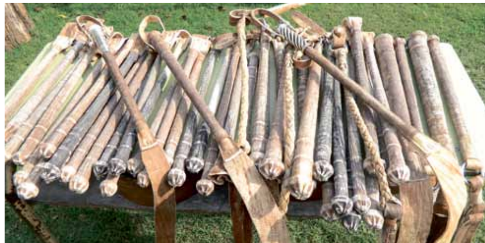
El cuero de cola de vaca es fino y resistente, puede durar mucho tiempo

En otro costado del galpón se hallan cortadas en lonjas varias; que han sido pasadas en la sobadora y están listas para