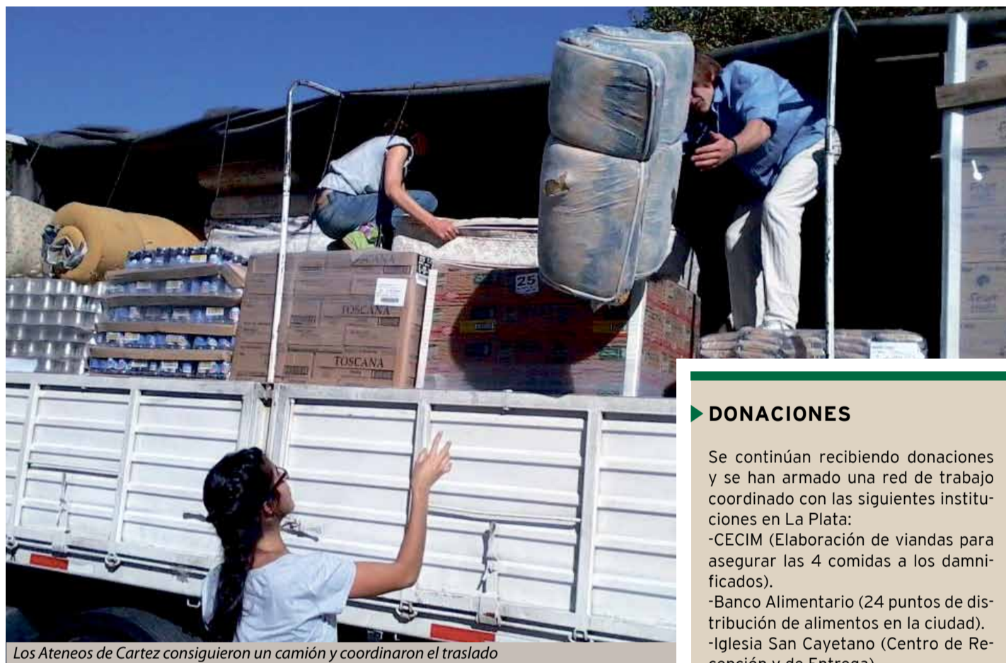
Los Ateneos de Cartez consiguieron un camión y coordinaron el traslado

“Para trasladarlas, cada zona se organizó de la manera que mejor convenía. Varios ateneos de Carap y del NEA enviaron donaciones desde sus lugares y coordinados con otras instituciones locales. Los Ateneos de Cartez consiguieron un camión y coordinaron entre ellos para aprovechar ese