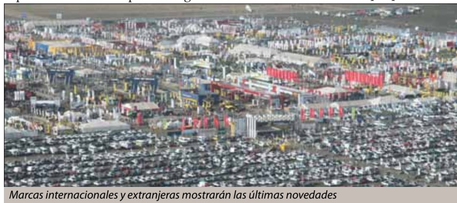
Marcas internacionales y extranjeras mostrarán las últimas novedades

capacidad para manejar una producción que este año según las más serias estimaciones rondará los 100 millones de toneladas. Recuerdo cuando hace unos 10 años hablábamos de estos números y parecía una utopía, pero con la incorporación de tecnología y sangre joven capacitada en el campo de Argentina